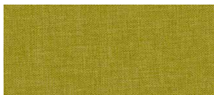
▲ Hellgrün (Stoff | Tiba Bur 6210)