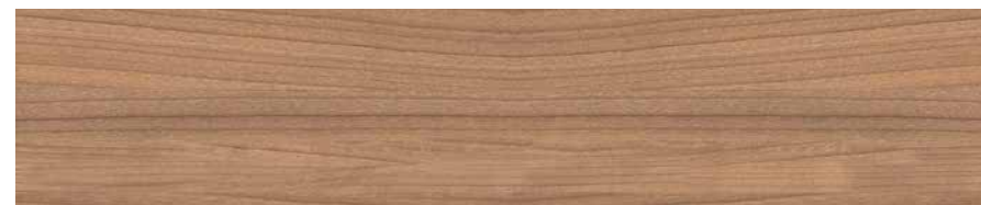
▲ Kirsche Havanna

Alle Stoffe und Dekore frei kombinierbar*