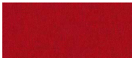
▲ Rot (Stoff | Tiba Bur 3210)