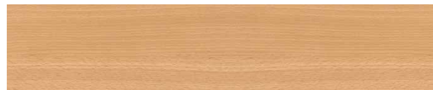
▲ Buche Natur