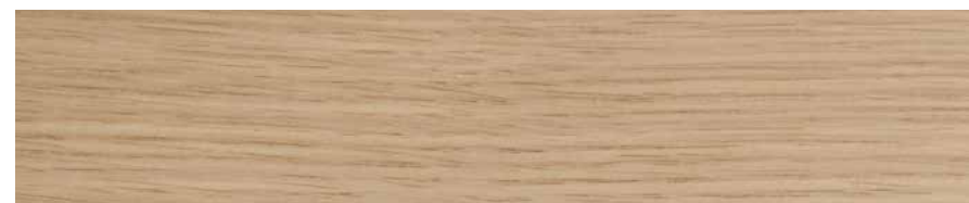
▲ Lindberg Eiche