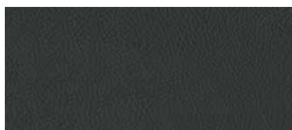
▲ Anthrazit (Kunstleder | Gaucho 1-1142 -395)